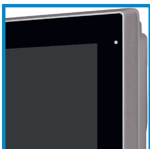
Flächenbündige Front Flush front