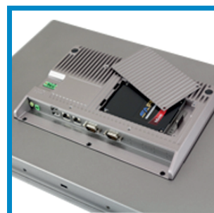
Festplatten-Wechselschacht Hard disk quick-change frame