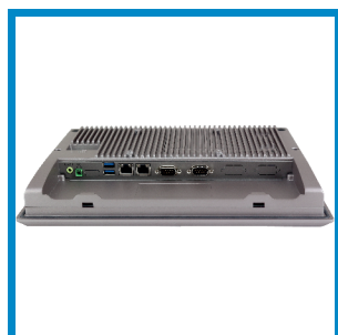
Vielfältige Schnittstellen Various interfaces