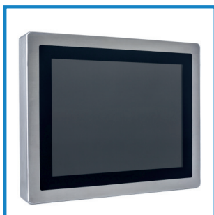
Rundum IP 65 All around IP 65