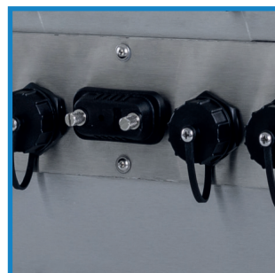
Industriekonnektoren Industrial connectors